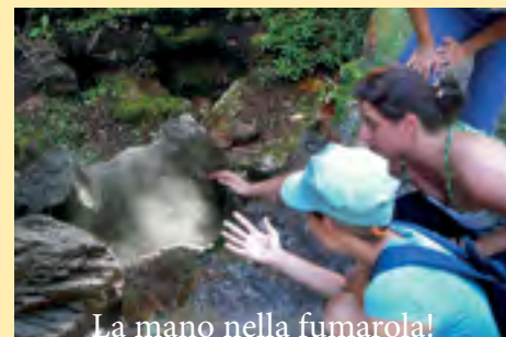
La mano nella fumarola!